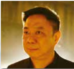
楊 煦生 (Yang Xusheng)

静岡県知事。早稲田大学卒業(1972年)、オックスフォード大学博士(1985年)。早稲田大学政治経済学部教授、国際日本文化研究センター教授、静岡文化芸術大学学長を経て2009年より現職。著書に『文明の海洋史観』ほか。